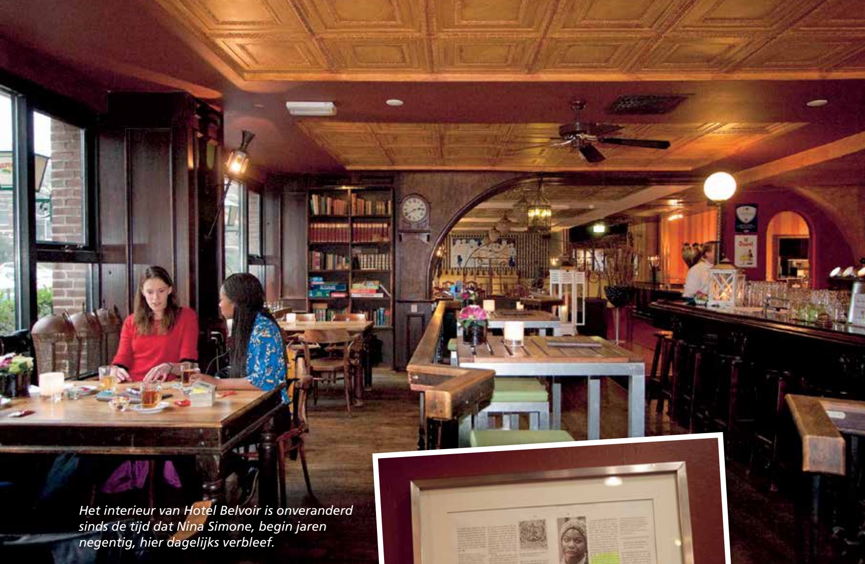
Het interieur van Hotel Belvoir is onveranderd sinds de tijd dat Nina Simone, begin jaren negentig, hier dagelijks verbleef.